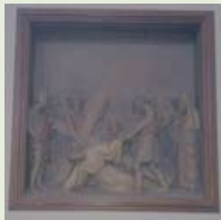
Na het schoonmaken