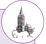
Voor het schoonmaken

Openingstijden secretariaat: woensdag en vrijdag 09.00-11.30 uur.