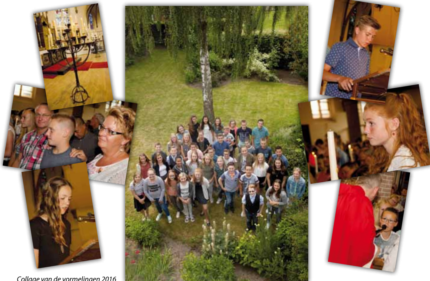
Collage van de vormelingen 2016