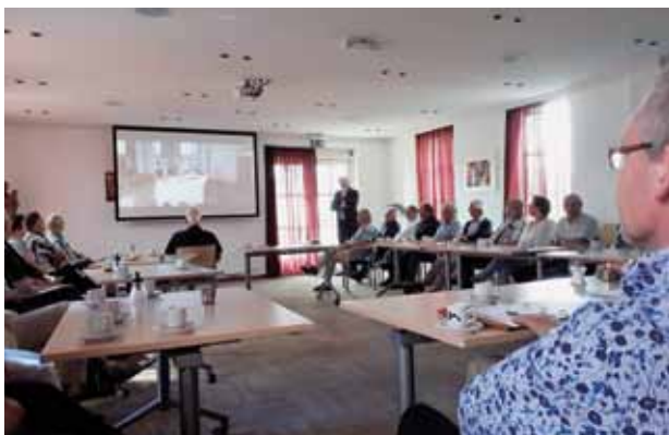
Aandacht voor de presentatie