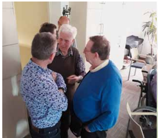
Kosters in overleg