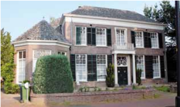
De ingang komt linksachter bij de garage. En de brievenbus links achter het Mariabeeld.

Het parochiecentrum in Wehl, de mooie voormalige pastorie aan het kerkplein gaat in andere handen over. Omdat de koop nog niet definitief is, kan nog geen naam van de koper worden genoemd. Wel is duidelijk dat er enkele ruimten voor een aantal jaren terug gehuurd worden voor de St. Martinus geloofskern Wehl. Daarvoor waren wel enkele noodzakelijke aanpassingen nodig.