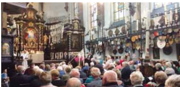
In de kaarsenkapel

Dit jaar wordt op woensdag 1 augustus aanstaande vanuit onze Parochie H. Gabriël wederom de jaarlijkse bedevaart naar Kevelaer gehouden. Traditiegetrouw zal Harmonie de Club uit Didam weer meegaan en voor de muzikale ondersteuning zorgen. De zang tijdens de plechtige Hoogmis (11.30 uur) en het Marialof (17.00 uur) in de Basiliek zal worden verzorgd door het Gabriëlkoor. Leden van het pastoraal team zullen deze dag in de vieringen voorgaan. 's Middags om 14.30 uur wordt in het park de grote kruisweg gelopen en voor diegenen die minder goed ter been zijn is er een kleine kruisweg in de Pax Christikapel. Tussendoor is er tijd om persoonlijk de heiligdommen te bezoeken en te zorgen voor de inwendige mens.