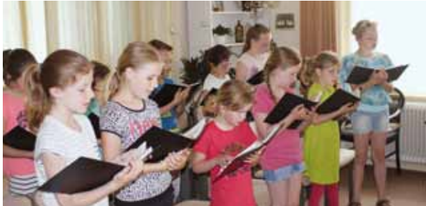
Gezellig samen zingen

Als je op een dinsdagmiddag zo rond 16.00 uur – 17.00 uur langs de pastorie in Nieuw-Dijk loopt, kan je spontaan verrast worden door helder klinkende kinderstemmen. De voordeur staat open en de vrolijke klanken van kinderliedjes, al dan niet kerkelijk getint, zweven je tegemoet. Voor de redactie van De Gabriël aanleiding om daadwerkelijk eens een keer binnen in de pastorie te kijken, want het kinderkoor in Nieuw-Dijk, dat is een paar jaar geleden toch opgehouden te bestaan?