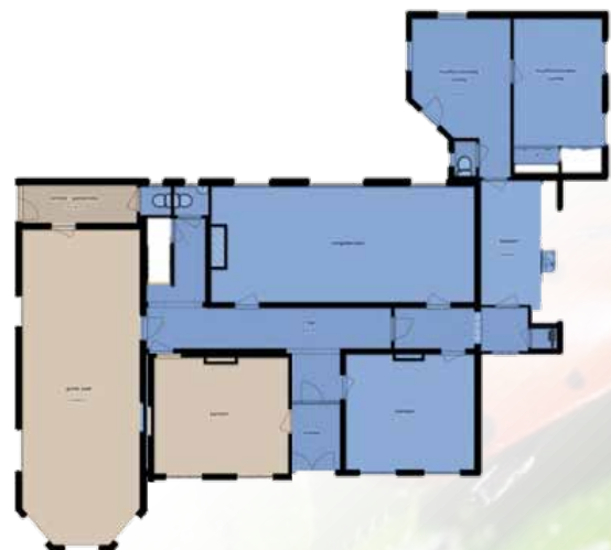
De plattegrond van het parochiecentrum. De grijs getinte oppervlakte is voor een aantal jaren terug gehuurd voor de St. Martinus geloofskern Wehl.