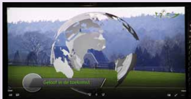
Start van de film 'Geloof in de toekomst'

In de wetenschap dat daarnaast het pastorale team binnen afzienbare tijd kleiner zal worden heeft het bestuur, in overleg met het pastoraal team, ertoe doen besluiten om niet af te wachten tot we onzichtbaar waren geworden in de regio. Het bestuur en pastoraal team hebben daarom besloten om proactief de organisatiestructuur van de parochie te veranderen en een aantal kerkgebouwen te sluiten. Op deze manier willen ze investeren in 'Geloof in de toekomst'. Als gevolg daarvan worden de locatieraden opgeheven. Om hen te bedanken voor hun enorme inzet gedurende de afgelopen acht jaar kwamen de leden van de locatieraden op 21 april jongstleden bijeen bij Jan & Jan in Didam.