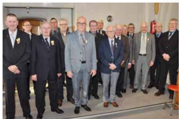
Het voormalige Gregoriaans koor tijdens hun laatste viering