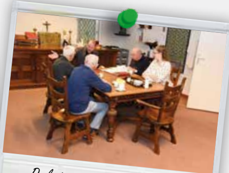
De laatste voorbereidingen in de sacristie