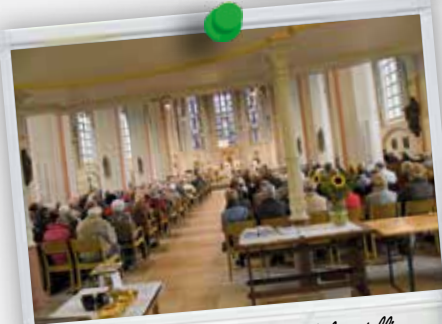
Ondanks het weer een warme belangstelling