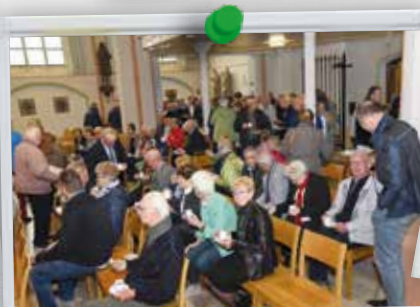
Gezellig samenzijn in de kerk