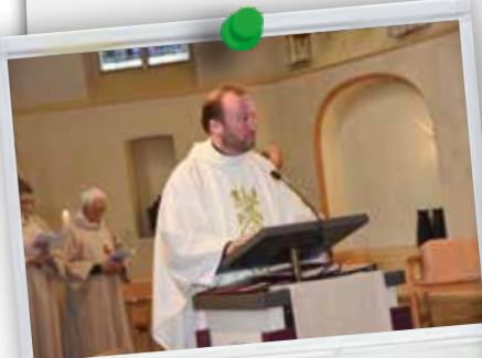
Het gehele pastorale team ging voor