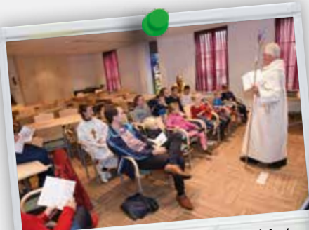
De kinderen gingen op reis naar Engel-land