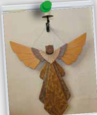
De engel... centraal in deze viering en op deze dag!